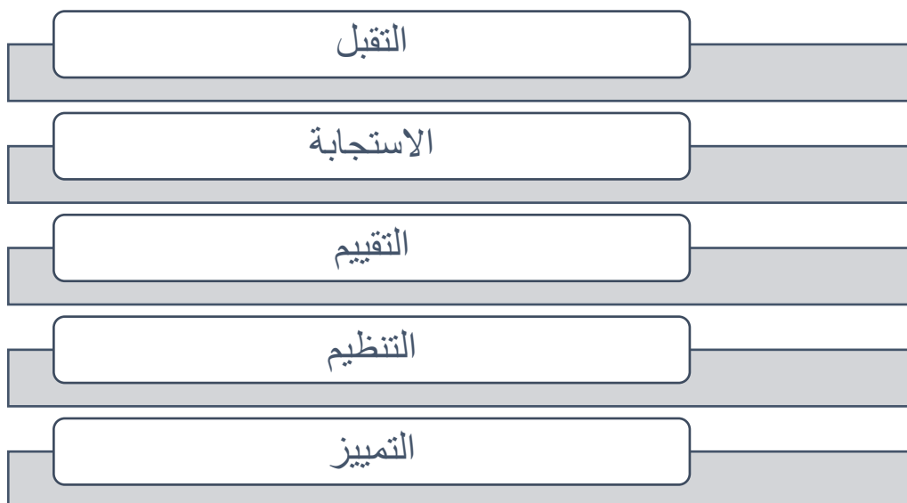
شكل (2) مستويات المجال الوجداني

وهذه المستويات هي مستويات المجال الوجداني: