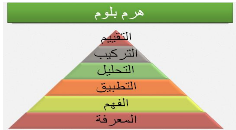
شكل (1) هرم بلوم