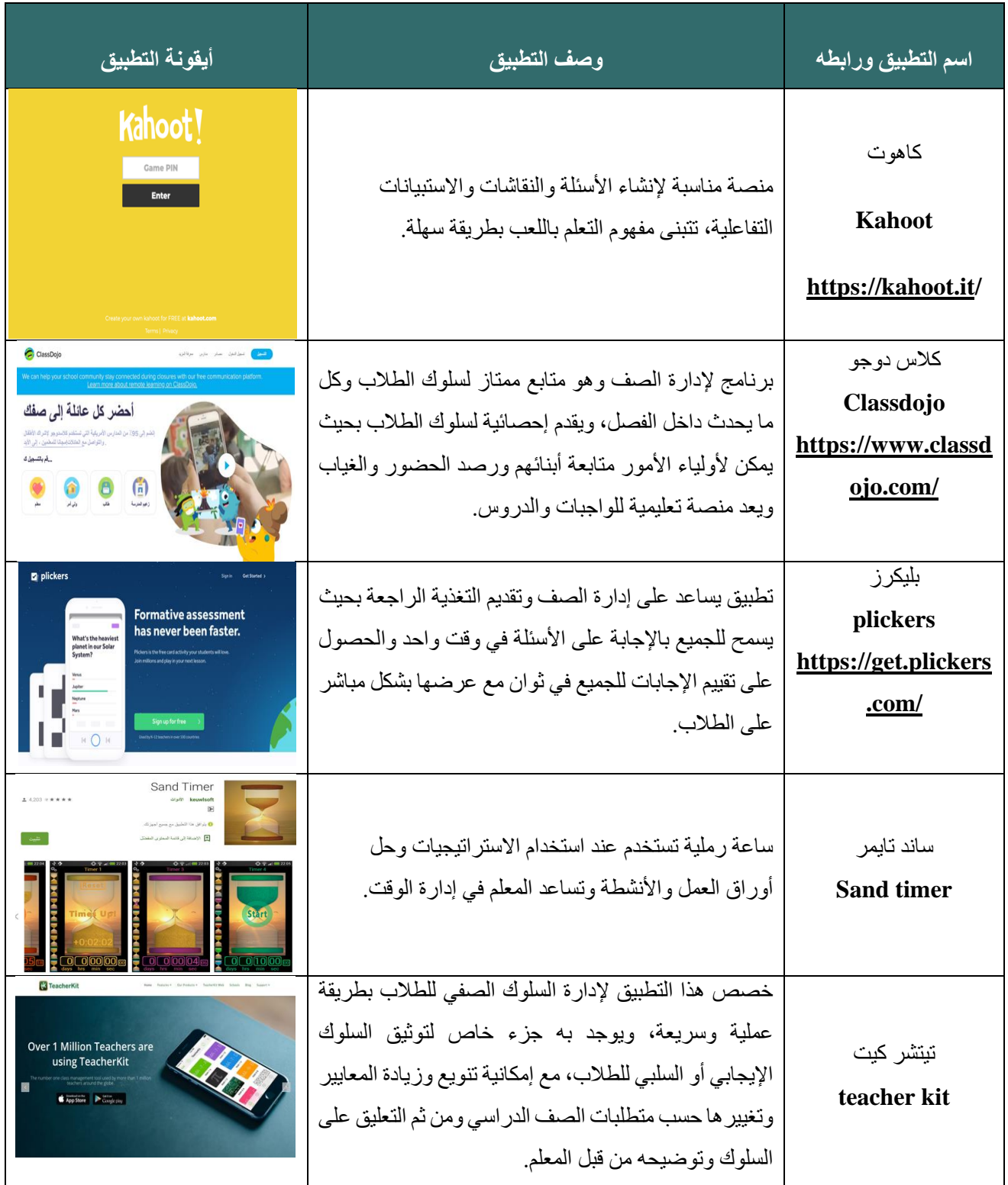
جدول (8) أبرز التطبيقات التقنية لإدارة الصف